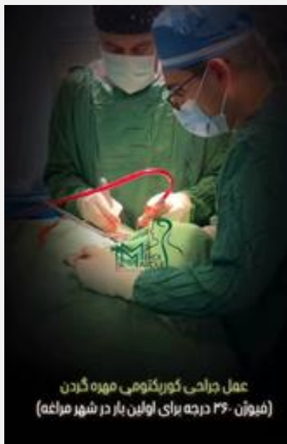
عمل جراحی کورپکتومی مهره گردن (فیوژن 360 درجه برای اولین بار در شهر مراغه)

تعبيه مهره گردنی مصنوعی (فیوژن 360 درجه گردن)